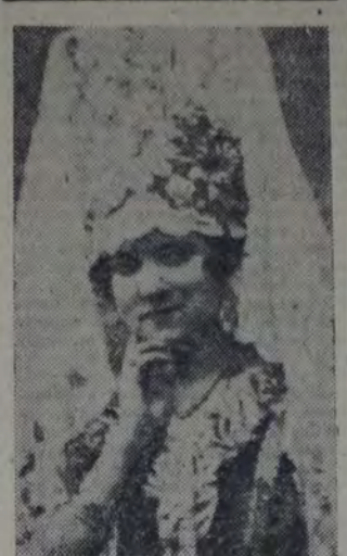
LA SOPRANO BIDU SAYAO, UNO DE LOS POCOS BUENOS ELEMENTOS QUE ES POSIBLE DESTAER EN LA ACTUAL TEMPORADA LIRICA DEL COLÓN.