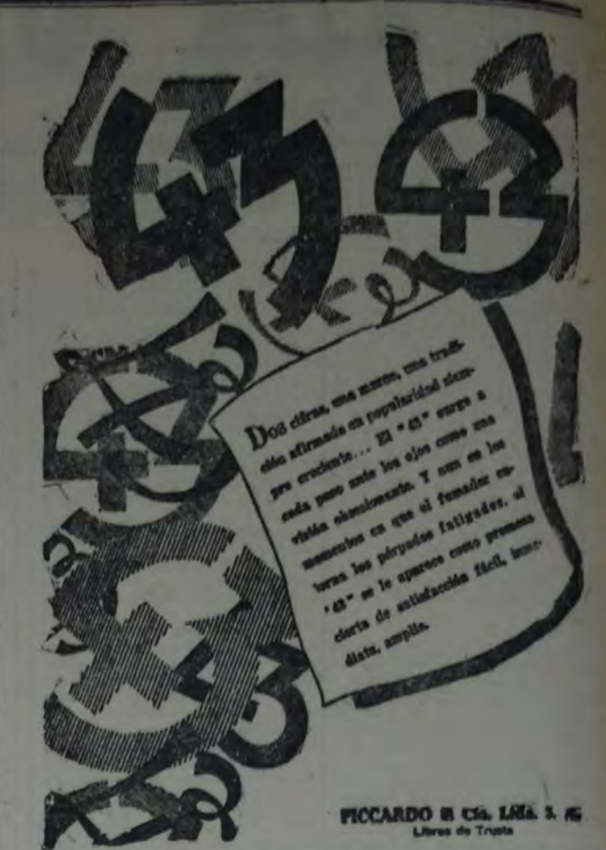
FICCARDO en Cal. L. 1. 16 Libro de Truque

Por otra parte, aunque con menos rapidez que en las grandes regiones industriales de Europa, en Rusia se manifiesta también el proceso de concentración urbana, que es una de las características esenciales de la civilización moderna. Si bien algunas ciudades se despoblaron durante la gran crisis de 1915-1922, algunas recuperaron, y en 1927 había en Rusia 31 ciudades con más de 100.000 habitantes, 59 entre 50 y 100.000 habitantes, 133 entre 20 y 50.000. La proporción de la población urbana en relación al total es mucho más débil, sin duda alguna, que en Inglaterra (79 %) o que en Alemania (62), puesto que no pasa de 17.9 %. Pero en la región